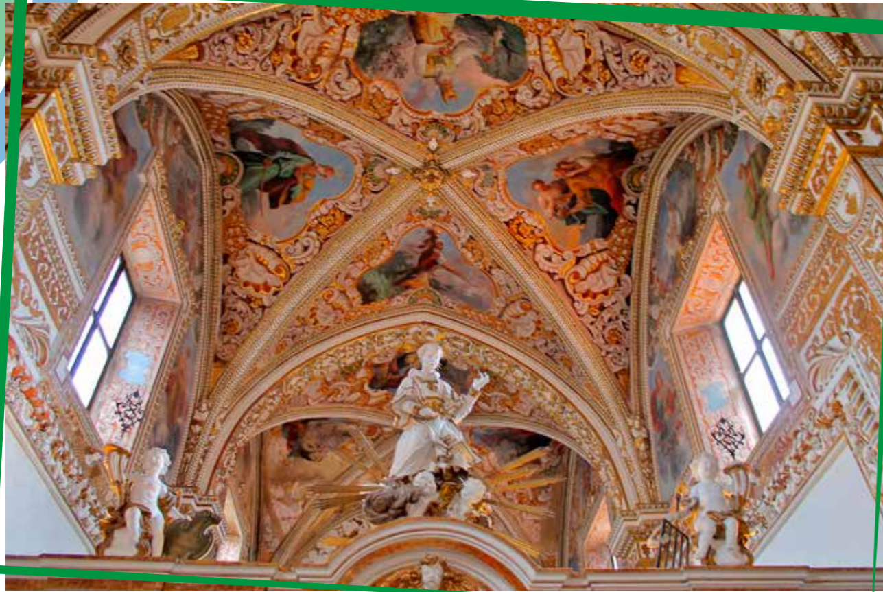
lo sfarzo principesco della "chiesa d'oro"