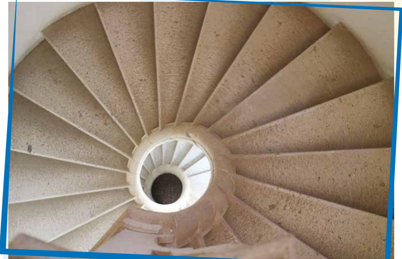
l'eleganza della scala a chiocciola