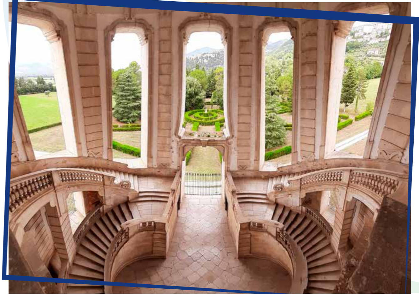
l'imponenza dello scalone vanvitelliano e tantissimo altro...