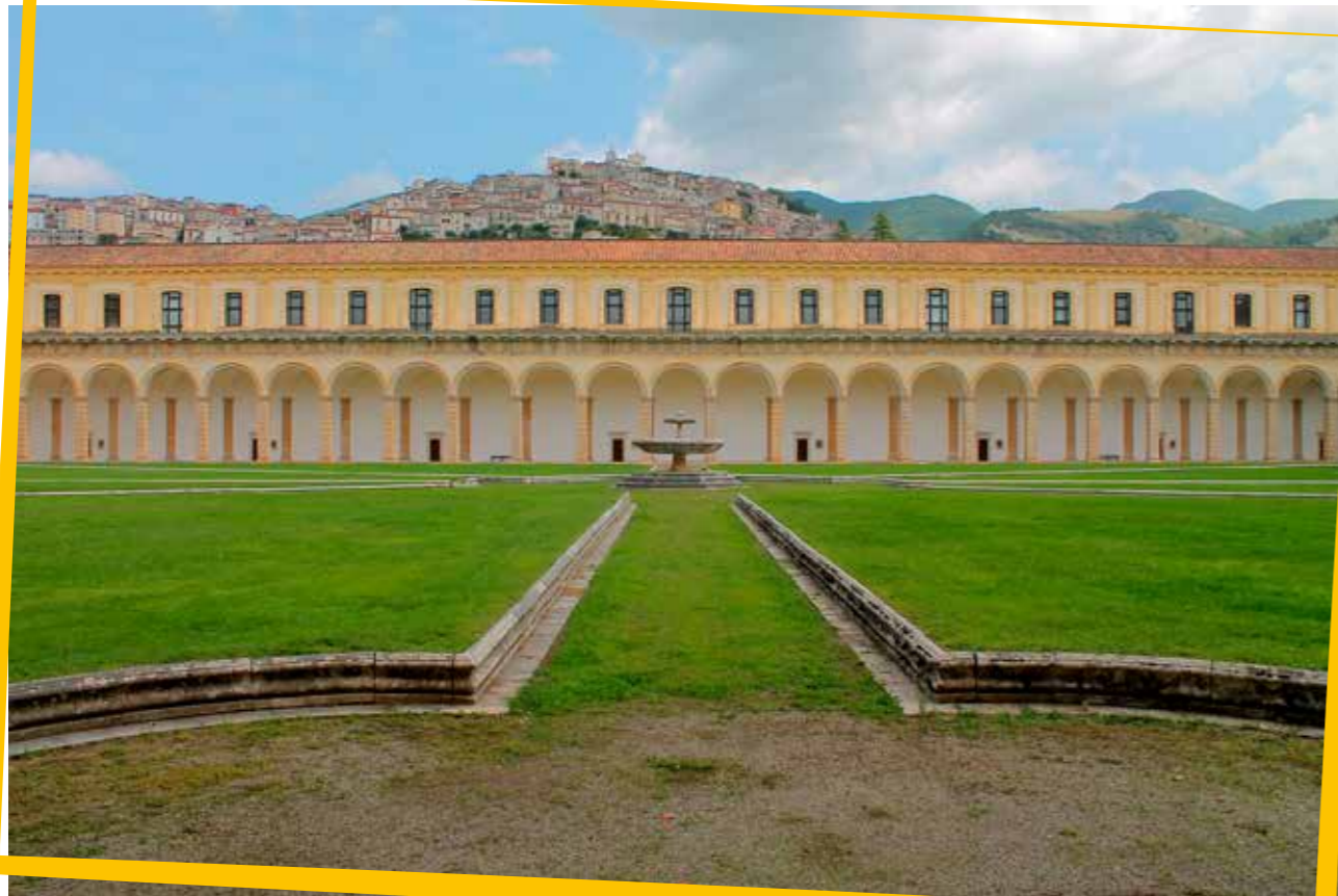
l'immensità del chiostro grande